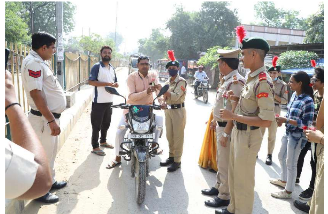
Traffic Awareness on 6.10.2021