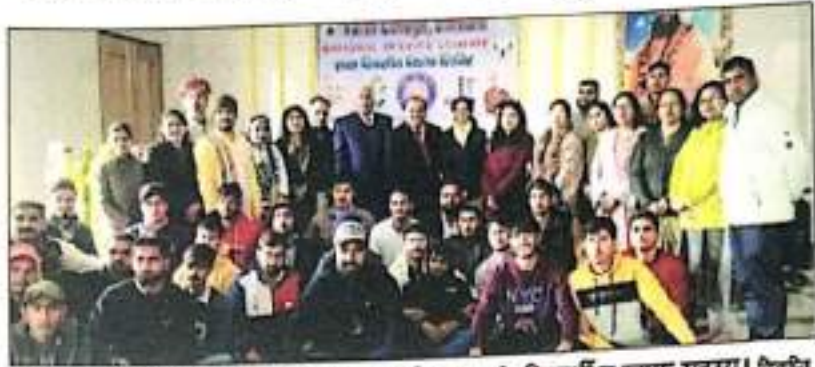
बाबा जहंगीरी आश्रम में उपस्थित वैश्य महाविद्यालय के विद्यार्थी व स्टाफ सदस्य।