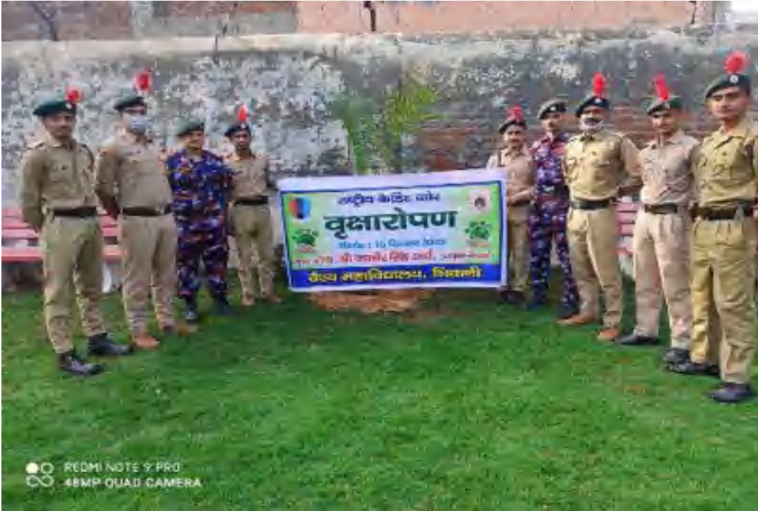
NCC TREE PLANTATION CAMP ON 15.12.2020