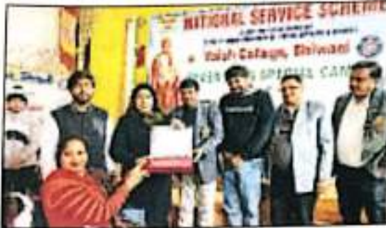
भिवानी। शिक्षिका को सम्मानित करते अतिथिगण।