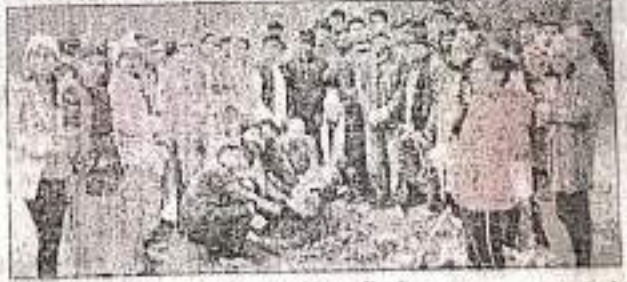
भिवाली। कैम्प के दौरान पौधारोपण करते विद्यार्थी व शिक्षकगण।