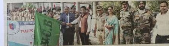
जागरूकता रैली को हरी झंडी दिखाकर रवाना करते अतिथिगण। विजयि