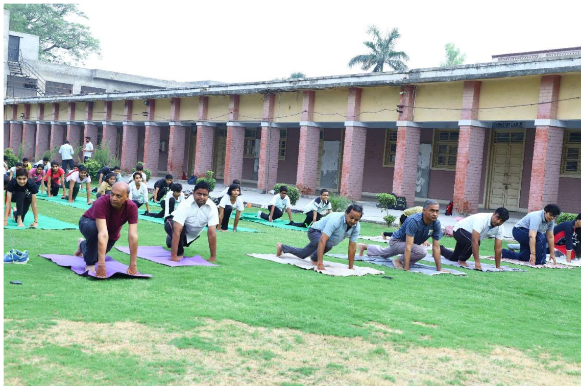
International yoga day on 21 June 2019