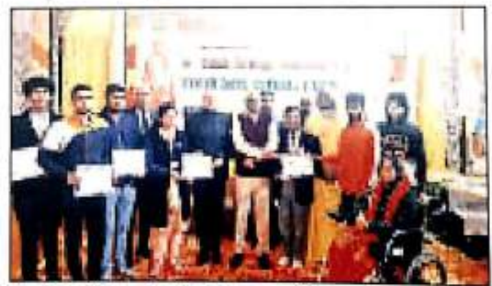
भिवानी। आयोजित कार्यक्रम में उपस्थित मुख्य अतिथि व अन्य।

राष्ट्र के सामाजिक विकास में एनएसएस स्वयं सेवकों का महत्वपूर्ण योगदान: मित्तल हरिभूमि न्यूज ►► भिवानी