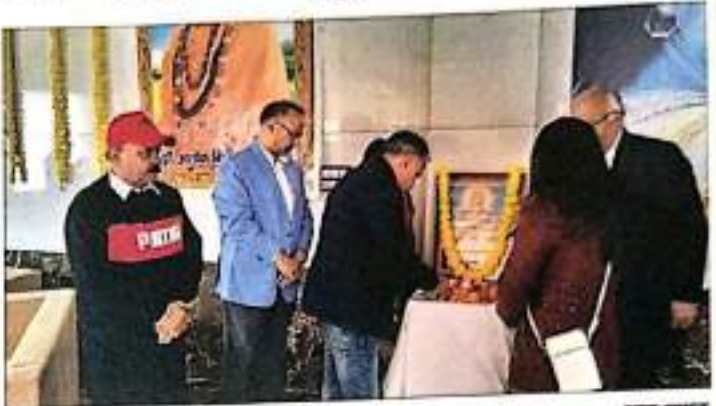
राष्ट्र के सामाजिक विकास में स्वयं सेवकों का महत्वपूर्ण योगदान है।

स्वयंसेवकों को उत्साह के निम्न के साथ ही प्रेरित करने की सीख दी। आज शिक्षित के सफल समाज के सुशासन सुशासनिक जीवन को संचालित करने के लिए निरुत्थार्य भाव से ठीक गई सेवा वास्तव में सच्ची सेवा-मनोज दलात है।