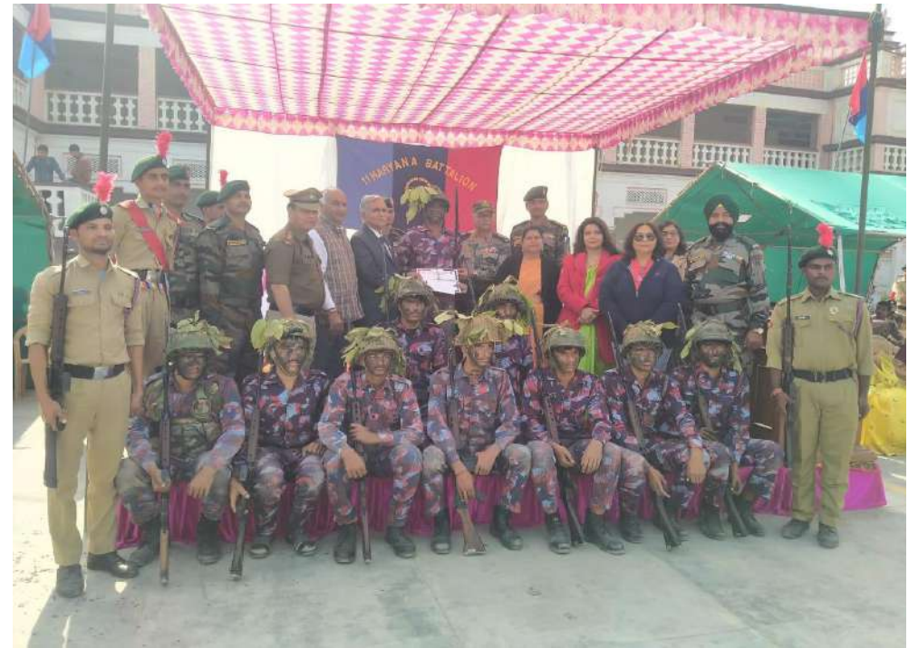
Cultural, Drill, Section Battle Drill on 26.11.2021