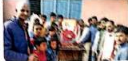
स्वामी विवेकानंद के जन्म पर आयोजित कार्यक्रम

उत्प्रेरणा और तब तक तब तक... जब तक तब तक की शक्ति का ही जग