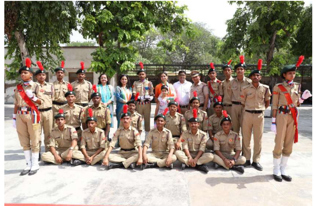
Independence Day on 15.8.2021