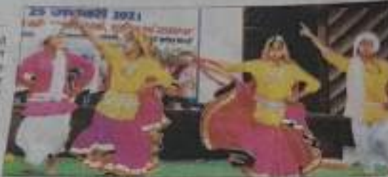
मताधिकार दिवस में आयोजित सांस्कृतिक कार्यक्रम में प्रस्तुति देती छात्राएं।

विद्यार्थियों ने राष्ट्रीय मतदाता दिवस पर सभी कार्यक्रमों में सक्रियता से भाग लिया। जिलेभर में मतदान का दिन। राष्ट्रीय मतदाता दिवस पर जिलेभर में कार्यक्रम हुए और विद्यार्थियों ने सांस्कृतिक कार्यक्रमों से भी मतदान का संदेश दिया।