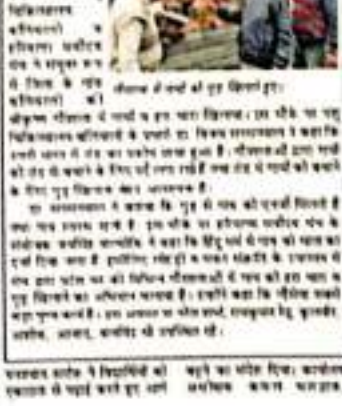
अनायास में लोहड़ी परे में भाग ले रहे हैं।