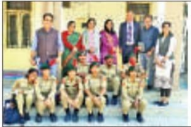
भिवानी: एनसीसी अधिकारियों के साथ कैडेट्स।