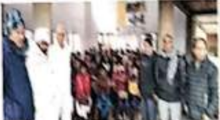
स्वामी विवेकानंद के जन्म पर आयोजित कार्यक्रम

युवा आगे बढ़ेगा तो देश बढ़ेगा... खेलचरदार