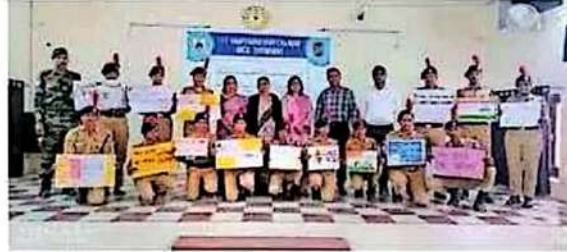
वैश्य महाविद्यालय में मौजूद विभिन्न महाविद्यालयों के एनसीसी कैडेट्स।