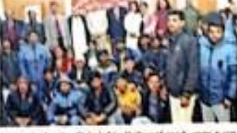
अनायास में लोहड़ी परे में भाग ले रहे हैं।

प्रतिष्ठान विद्यार्थियों को लोहड़ी परे विद्यार्थी 15 जनवरी (शुक्र) को प्रतिष्ठान के विद्यार्थियों को लोहड़ी परे के लिए प्रेरित किया गया। इस अवसर पर प्रतिष्ठान के विद्यार्थियों को लोहड़ी परे के लिए प्रेरित किया गया। इस अवसर पर प्रतिष्ठान के विद्यार्थियों को लोहड़ी परे के लिए प्रेरित किया गया।