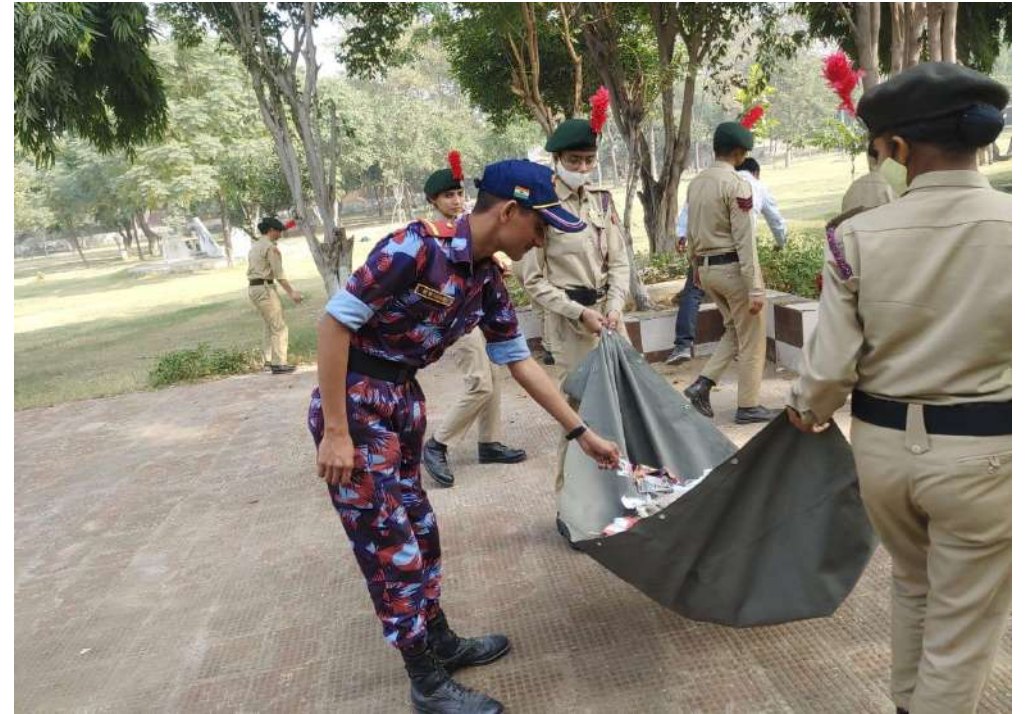
swachhta Abhiyan on 27.11.2021