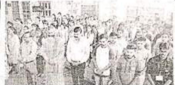
हनुमान जोहड़ी मंदिर में अमृतसर ट्रेन हादसे में मरे गए लोगों की आत्मा को शांति के लिए मौन करते शिविर में उपस्थित लोग।