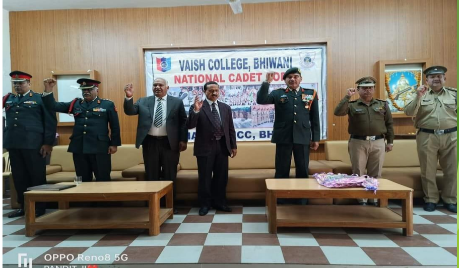
OPPO Reno8 5G PANDIT JI