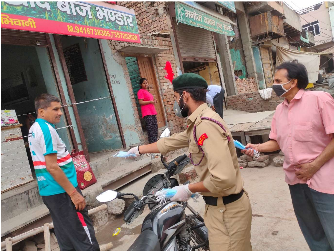
Mask distribution by NSS Volunteers on 21/05/2021