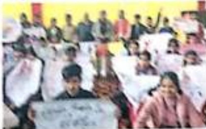
युवाओं के बीच स्वामी के जन्म समारोह

शहरोंकी वीरता उभार कर राष्ट्र के लिये युवा... स्वामी विवेकानंद के जीवन से प्रेरणा ले कर राष्ट्र निर्माण में योगदान दें युवा : धर्मवीर