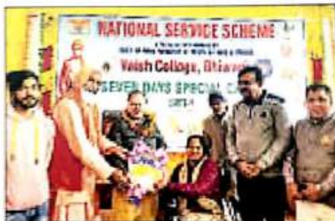
भिवानी। कार्यक्रम में मुख्य अतिथि को स्मृति चिह्न देकर सम्मानित करते हुए।

उन्होंने कहा कि राष्ट्र के विकास के लिए सामाजिक जागृति का होना जरूरी है। किसी भी राष्ट्र का सामाजिक ढाँचा जितना अधिक सशक्त और जागृत होगा वह राष्ट्र भी उतना नहीं सशक्त और जागृत होगा। उन्होंने कहा कि हमें अपने संसाधनों का सदुपयोग कर प्रकृति