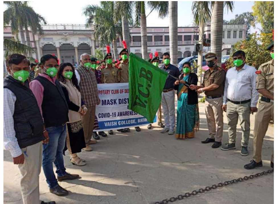
Rally on Covid 19 Awareness on 22.11.2021