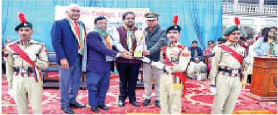
समारोह के दौरान एन.सी.सी. कैडेट्स को ट्राफी भेंट करते हुए प्राचार्य व ट्रस्टी।