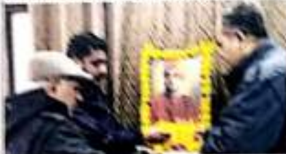
स्वामी विवेकानंद के जन्म पर आयोजित अतिथि कार्यक्रम

स्वामी विवेकानंद के जीवन से प्रेरणा ले कर राष्ट्र निर्माण में योगदान दें युवा : धर्मवीर