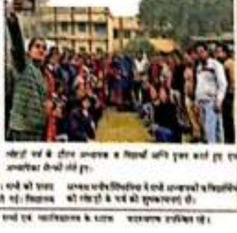
अनायास में लोहड़ी परे में भाग ले रहे हैं।