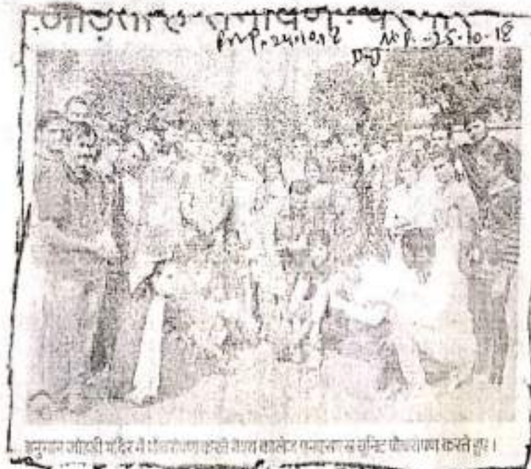
24.10.2018 Tree plantation by NSS VOLUNTEERS

हनुमान ज्योती मंदिर में पौधारोपण करती वैश्य महाविद्यालय समूह का स यूनिट पौधारोपण करते हुए।