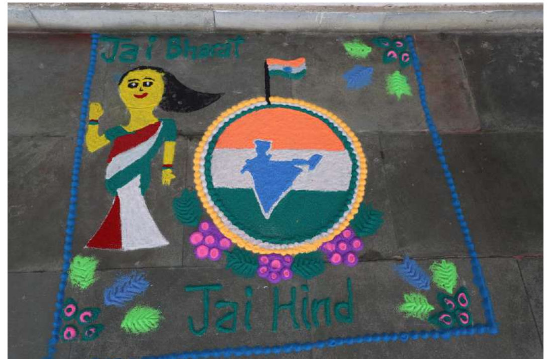
Rangoli & Poster making on 25.11 2021