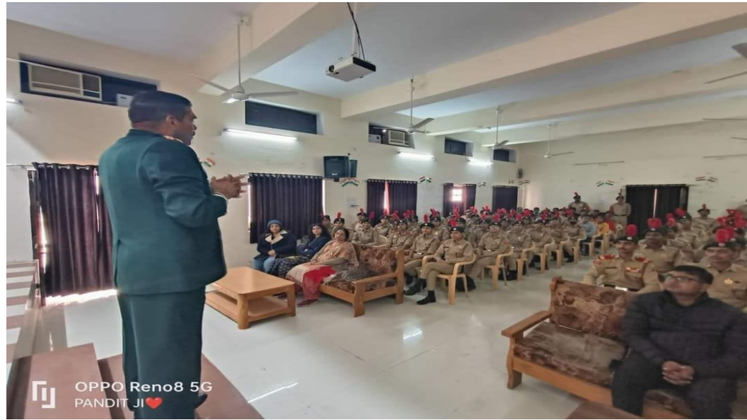
OPPO Reno8 5G PANDIT JI