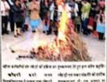
अनायास में लोहड़ी परे में भाग ले रहे हैं।