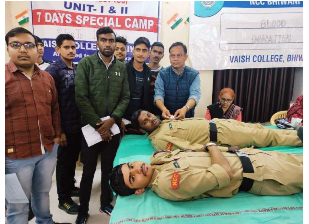
NCC Blood donation camp on 11.2.2022