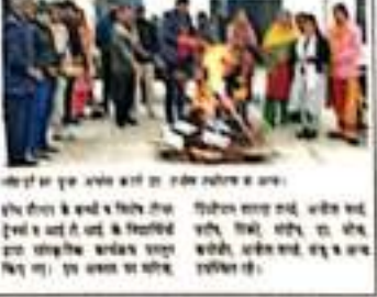
अनायास में लोहड़ी परे में भाग ले रहे हैं।