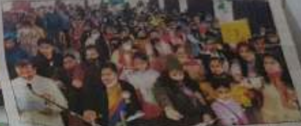
विद्यार्थियों ने राष्ट्रीय मतदाता दिवस पर अपना योगदान देकर मतदान का संदेश दिया।

राष्ट्रीय मतदाता दिवस पर सभी कार्यक्रमों में सक्रियता से भाग लिया। जिलेभर में मतदान का दिन। राष्ट्रीय मतदाता दिवस पर जिलेभर में कार्यक्रम हुए और विद्यार्थियों ने सांस्कृतिक कार्यक्रमों से भी मतदान का संदेश दिया।