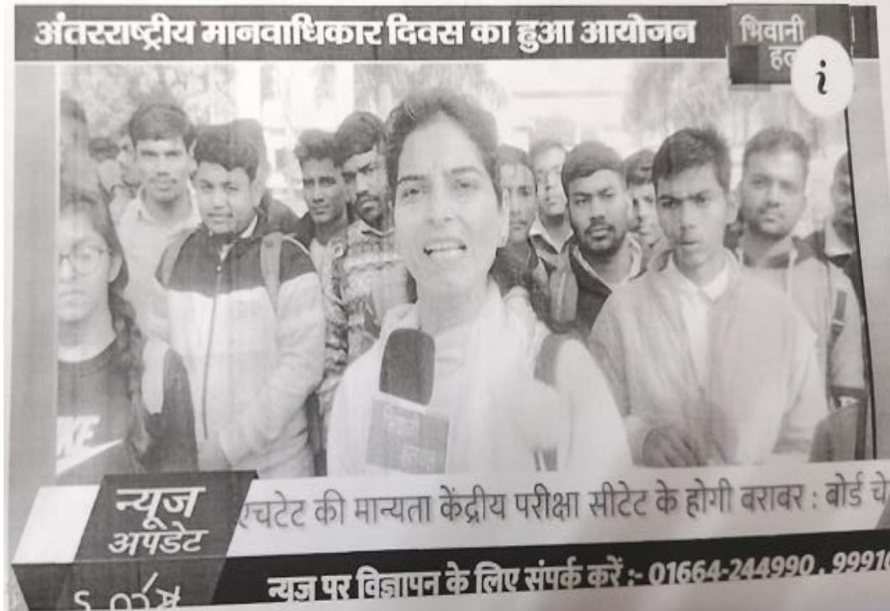
Awareness drive for Human Rights