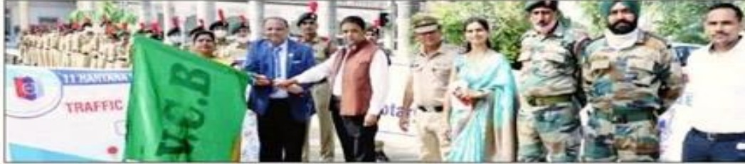
जागरूकता रैली को हरी झंडी दिखाकर रवाना करते अतिथिगण। विज्ञप्ति