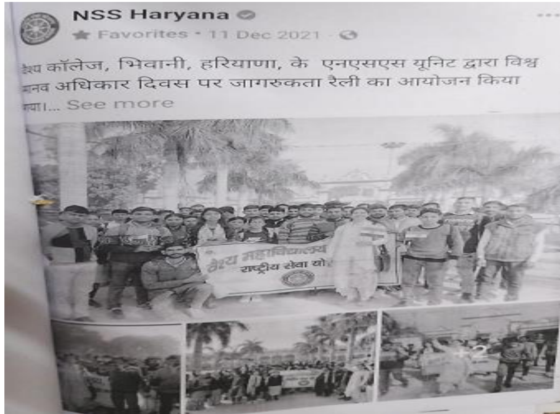
Human Right awareness campaign