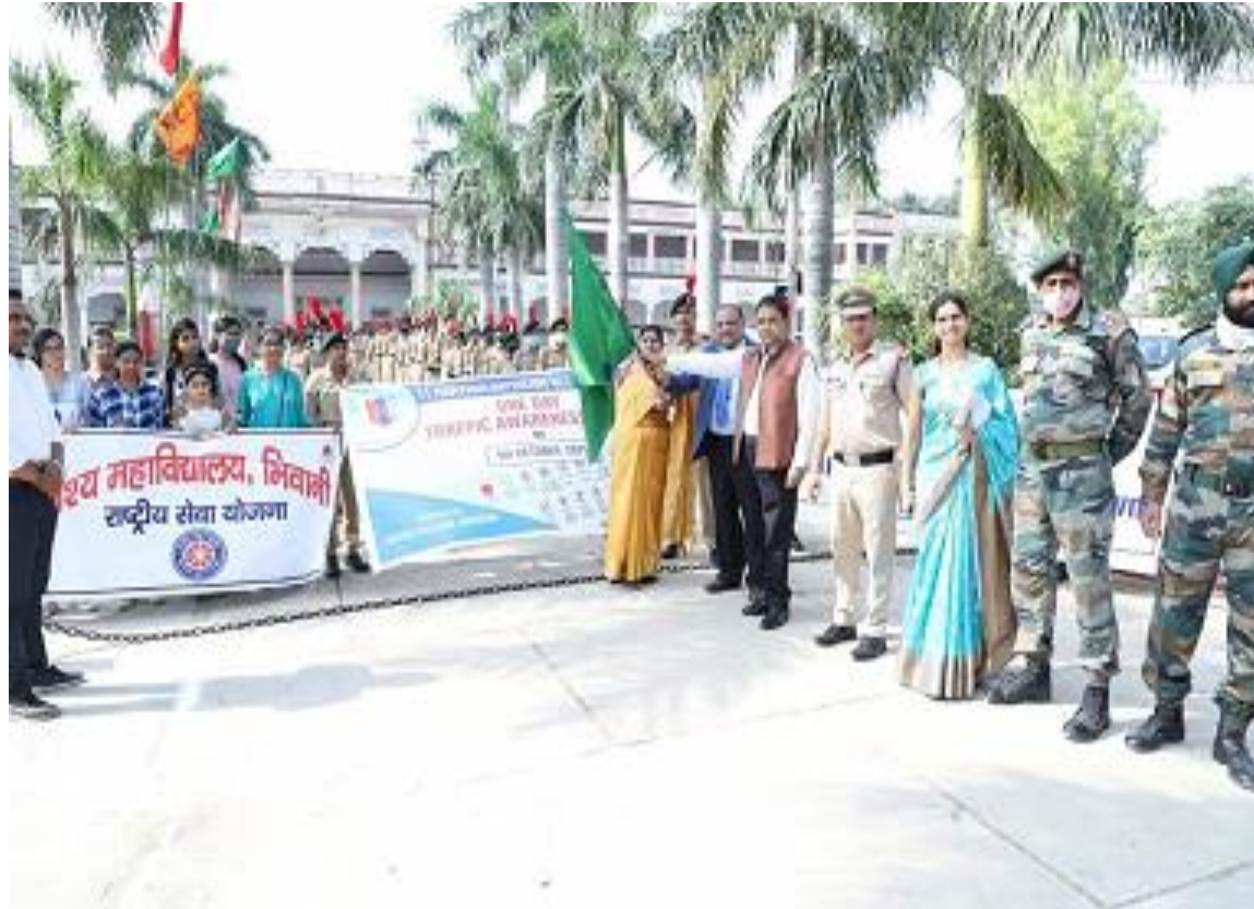
Rally To spread awareness regarding traffic rules and regulations