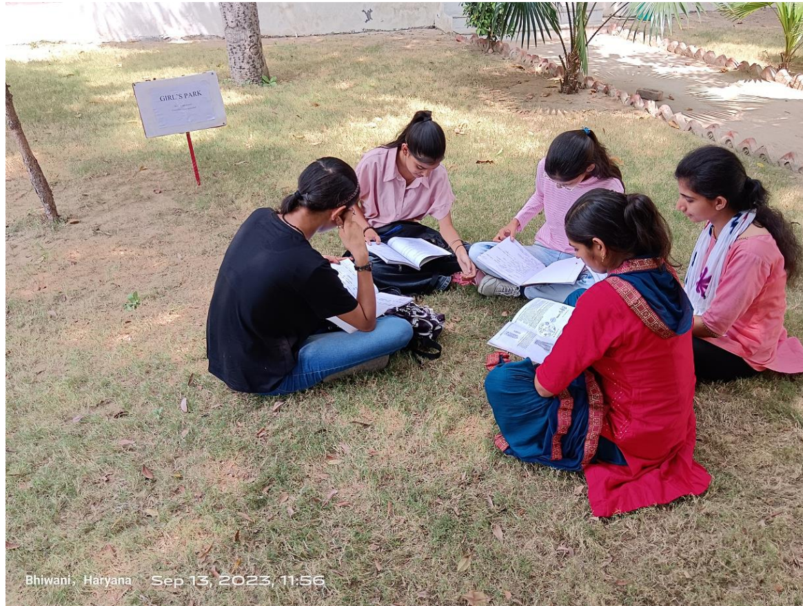
Girls studying in their own space i.e. Girls; Park