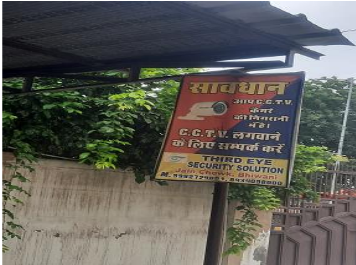
Placard Displayed to warn unsocial elements in Campus