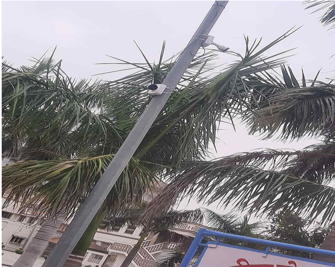
CCTV cameras installed at prime locations