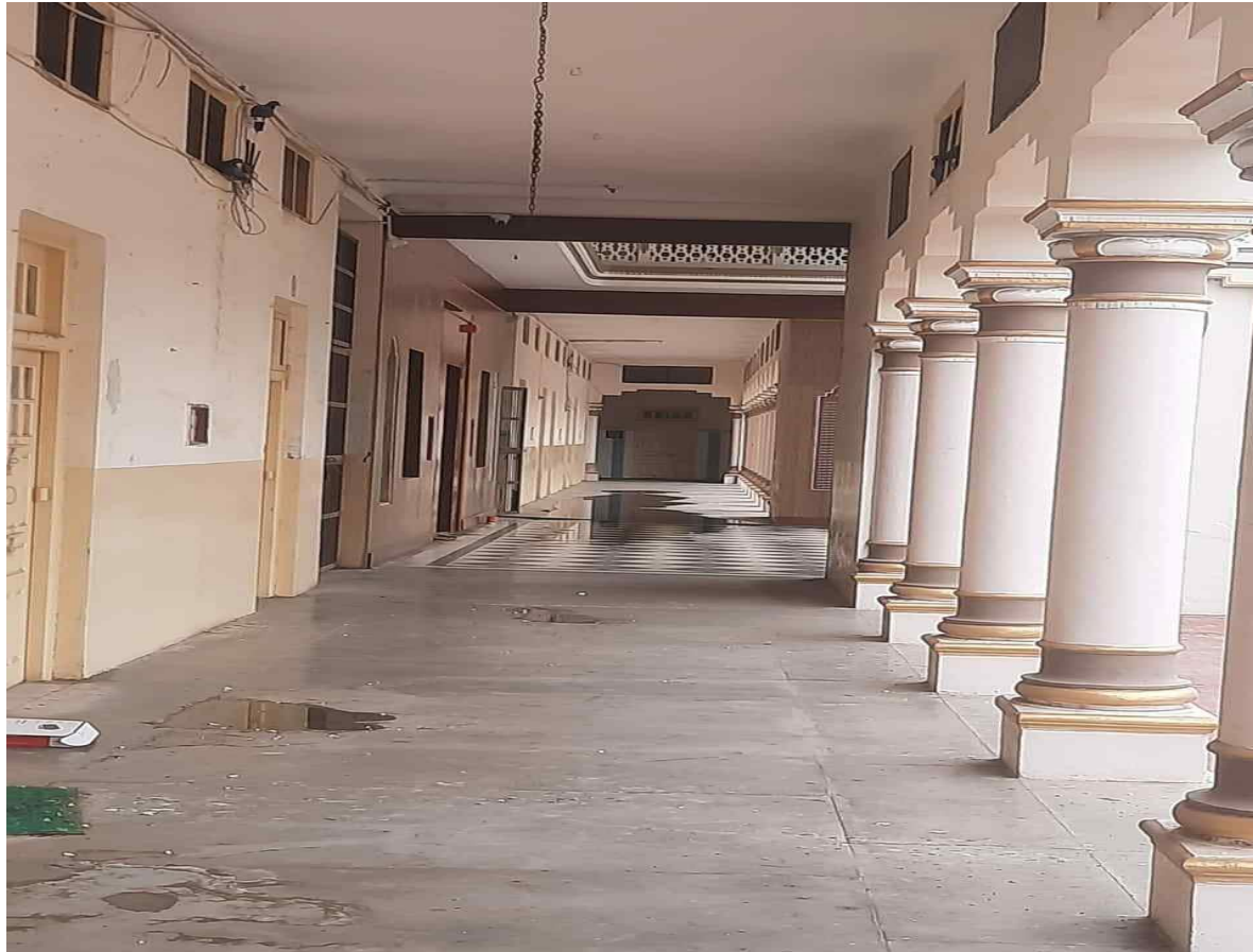
CCTV cameras installed at prime locations