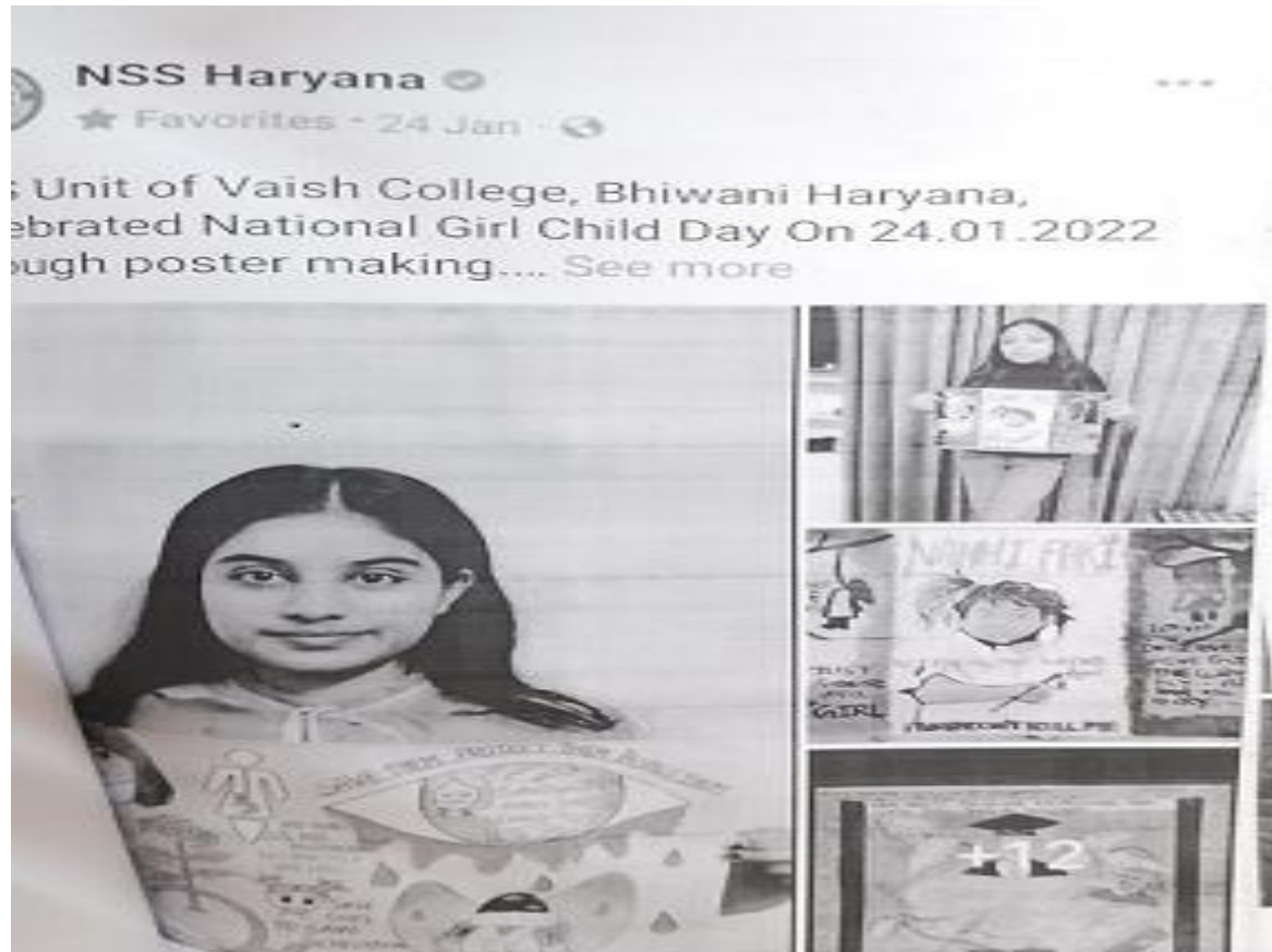
National Girls Child day celebration with poster making competition