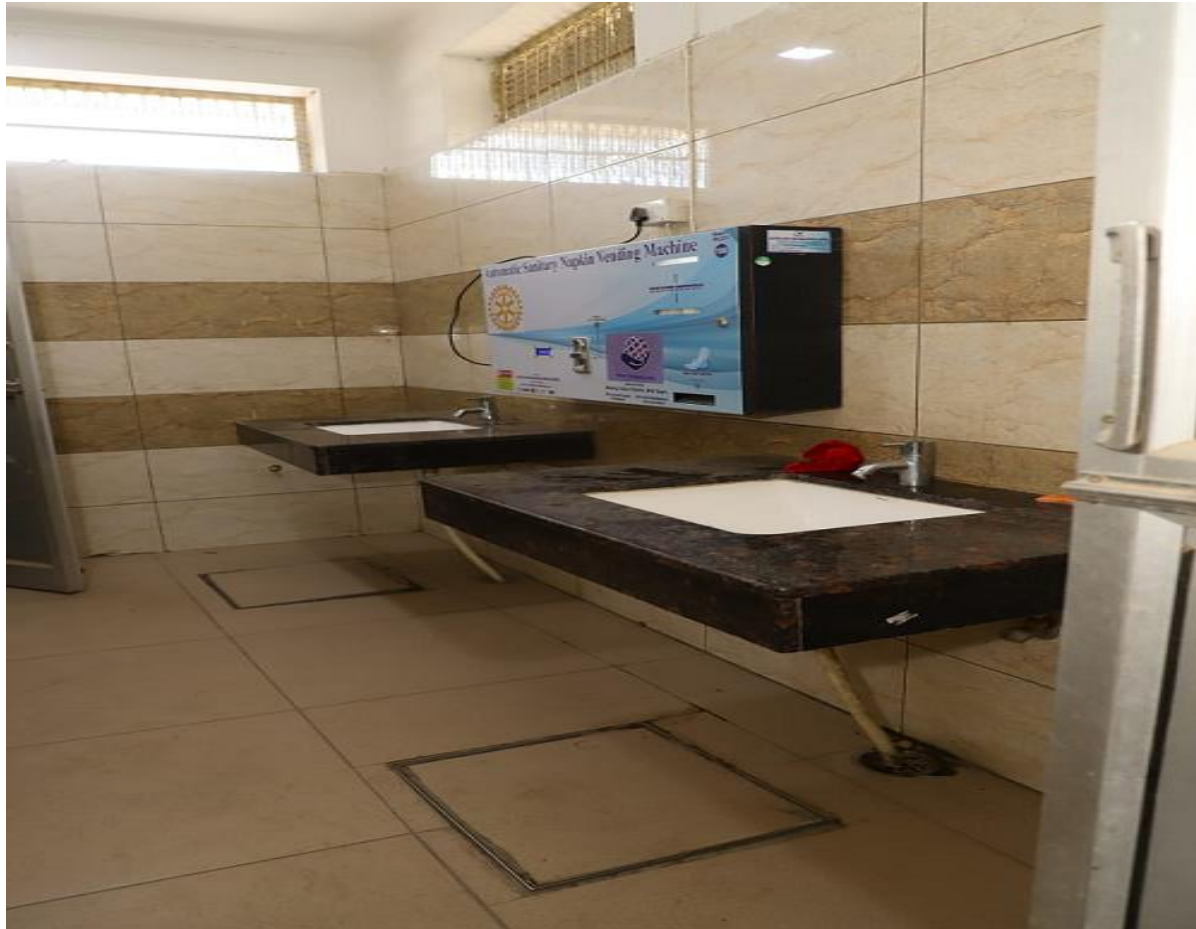
Sanitary pad vending Machine in wash-room of Girls' Common room