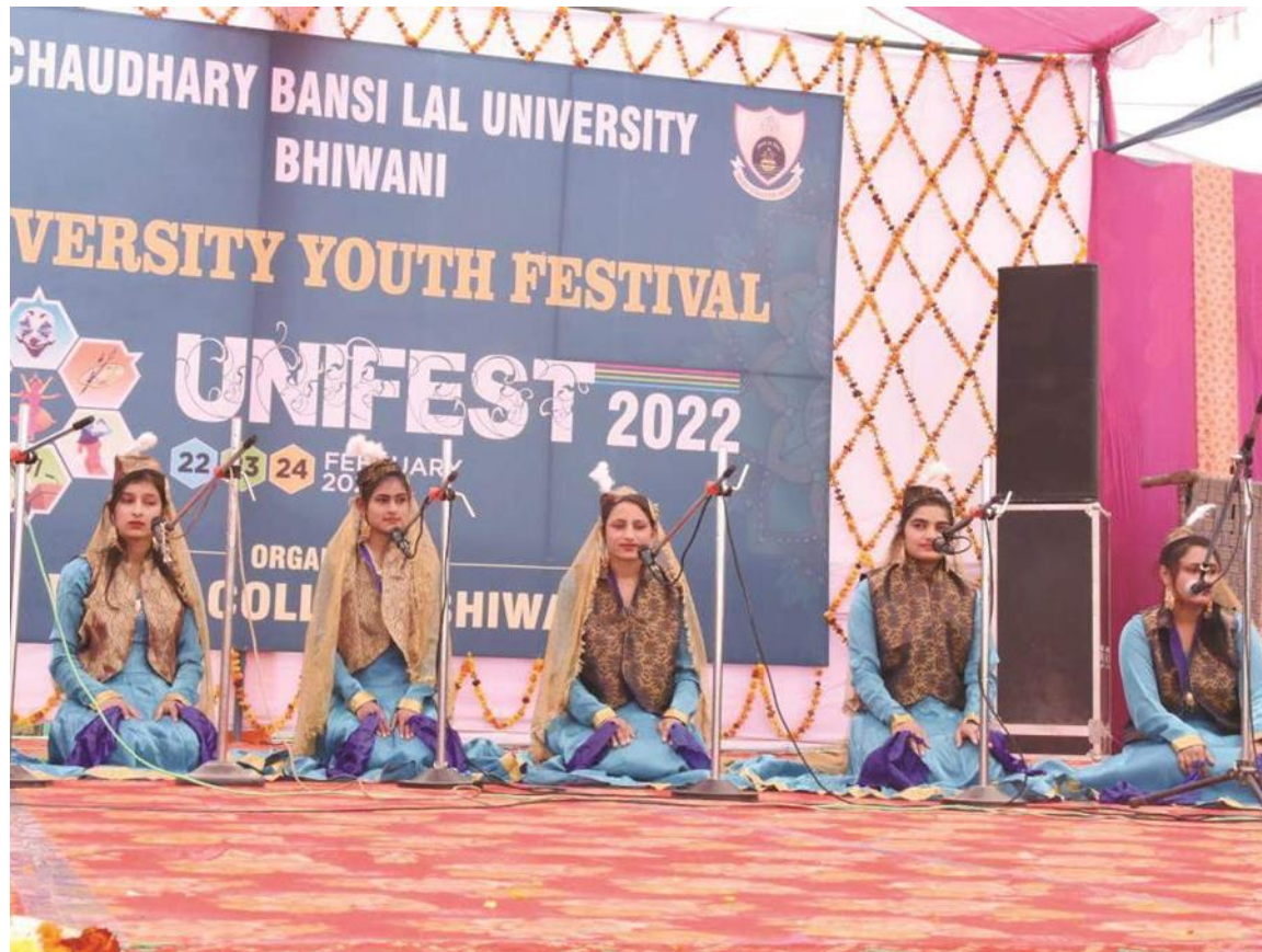
Girls' Participation in Youth festival 2022