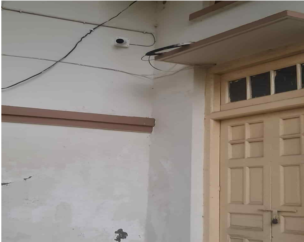
Close Circuit television camera installed in girls' lawn