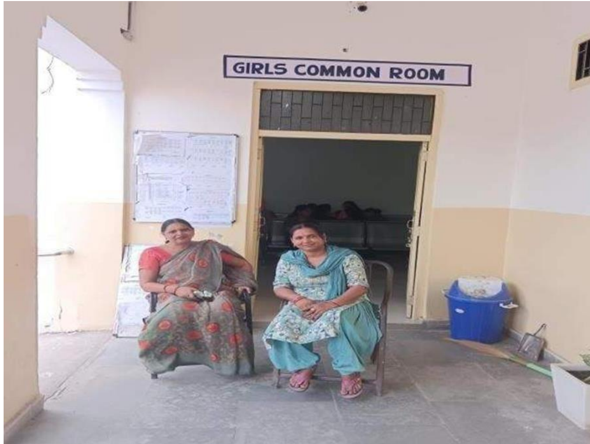
Women Guard in front of Girls ' Common Room