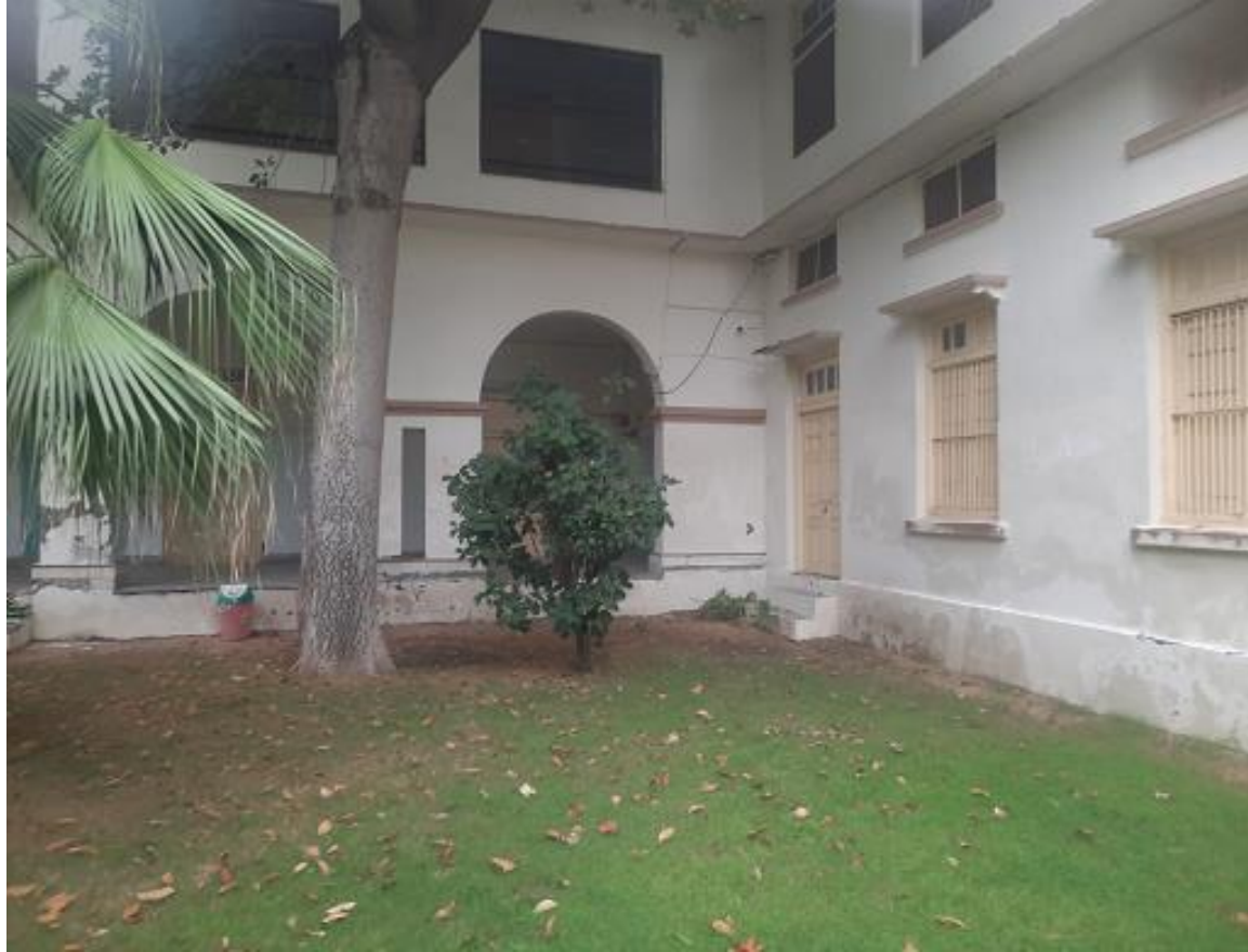
Close Circuit television camera installed in girls' lawn