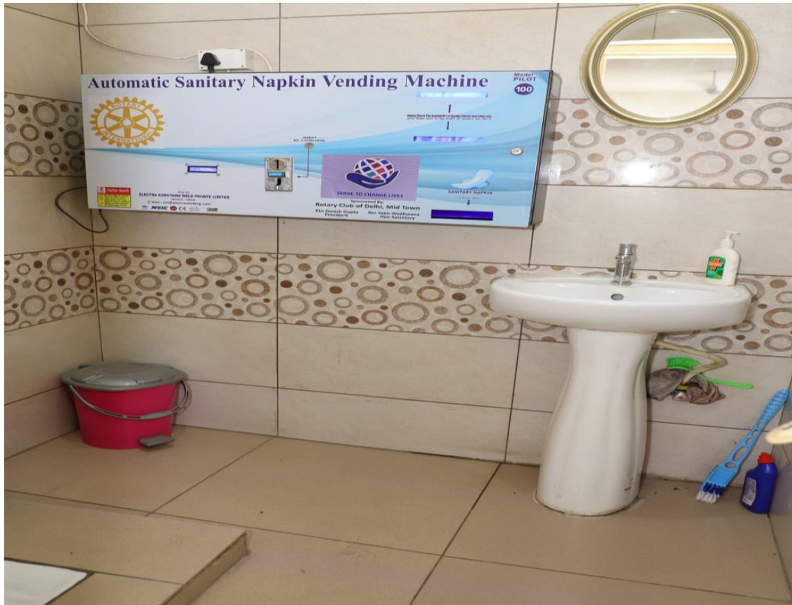
Sanitary pad vending Machine in Ladies wash-room of staff