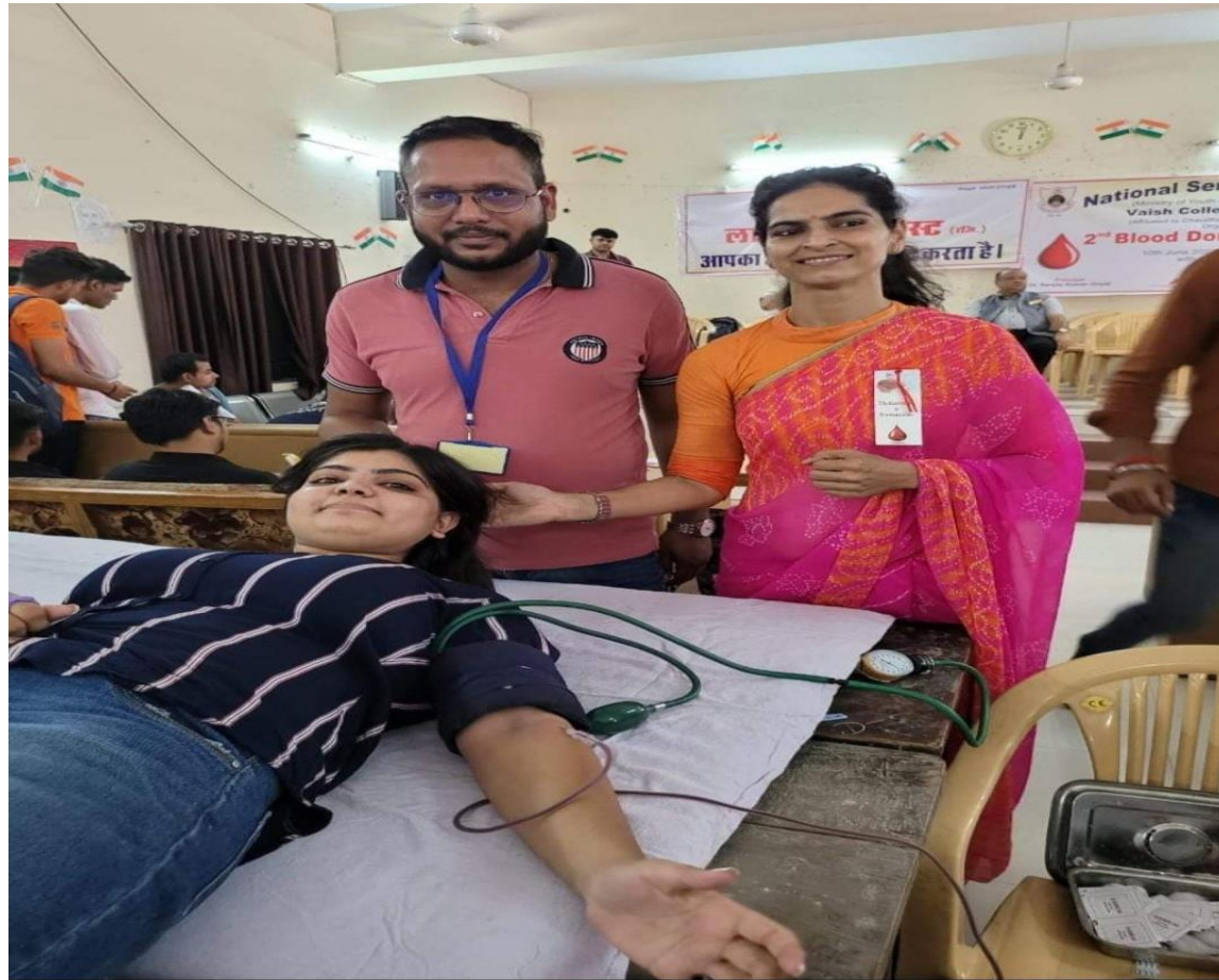
Girls' participation in Blood donation camp