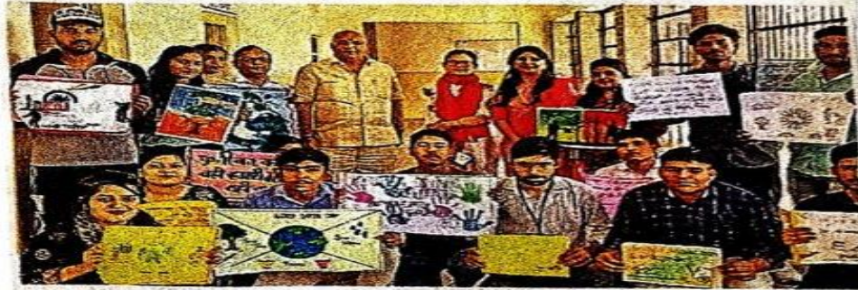
वैश्य कालेज में विश्व पृथ्वी दिवस पर स्लोगन लेखन व पोस्टर मेकिंग प्रतियोगिता में भाग लेने वाले बच्चे स्टाफ के साथ।