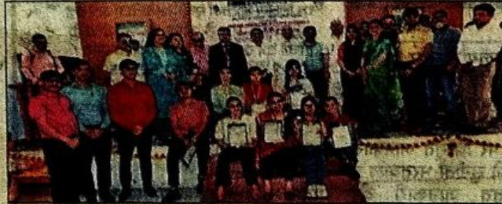
भिवानी। आयोजित कार्यक्रम में उपस्थित अधिकारी व प्रतिभागी।